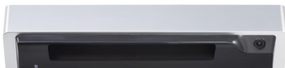
無駄開き防止自動ドアセンサー eスムーズセンサー VS-1

ドアの無駄開きを減らすことで、電力消費量を約30%削減（従来比）室内環境の向上に寄与しています。